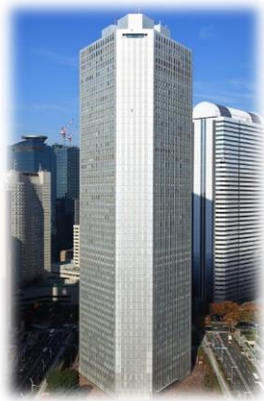
新宿住友ビル42階：本社